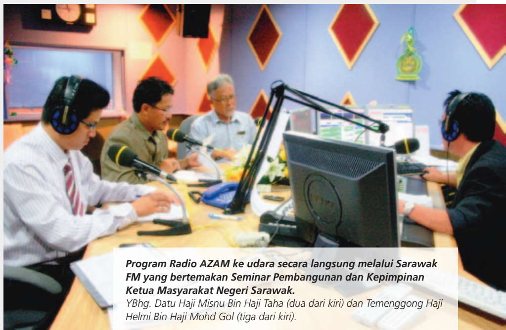
Program Radio AZAM ke udara secara langsung melalui Sarawak FM yang bertemakan Seminar Pembangunan dan Kepimpinan Ketua Masyarakat Negeri Sarawak.

dan Randau Pemansang Menua (Bahasa Iban) pada hari Selasa, jam 9.15 malam hingga jam 10.00 malam melalui frekuensi 101.3fm (WaiFM). Jangan ketinggalan dalam mengikuti slot rancangan radio AZAM yang akan datang kerana sudah pasti rancangan ini akan membincangkan tentang pembangunan di Sarawak yang perlu dikongsi bersama.